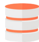
SQL Database Data Warehouse