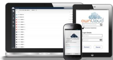
マルチデバイス対応

ユーザ専用のオンラインストレージが構築可能 なため、サービス型のオンラインストレージの問題を根本から解決可能です。また、専用クライアントアプリも用意した マルチデバイス対応 のため、DropboxやGoogle Driveと同様な使い勝手のサービスを安全に使用したい！というユーザーに、その代替ソリューションとして世界中で導入されています。