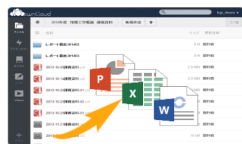
ドラッグ&ドロップ ファイル共有